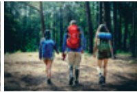
Kembara/ Merentas Hutan