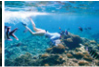
Aktiviti Bawah Air