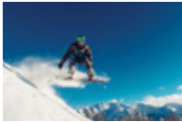
Ski/Luncur Papan Salji