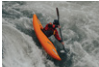
Rakit Redah Jeram