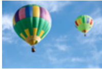
Belon Udara Panas